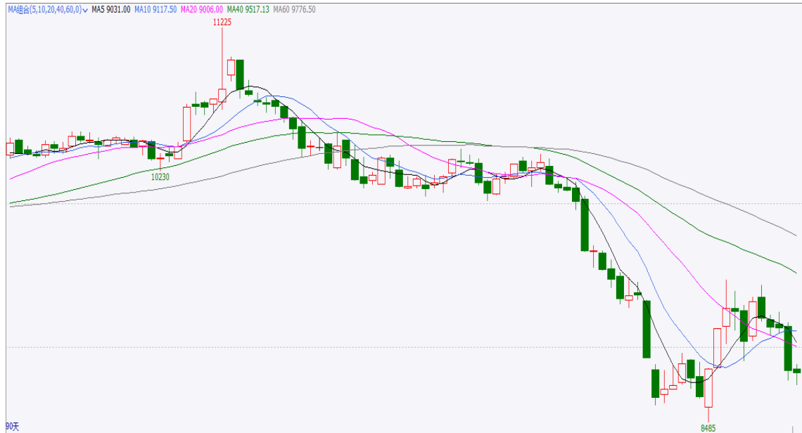
图 3 90 日期货行情走势

截止本周四，红枣期货合约 CJ109 开盘 8850，最高 8885，最低 8740，收盘 8825，涨-95 元/吨，涨幅-1.07%，成交量 83647 手，持仓量 38323 手，日增仓 722 手。