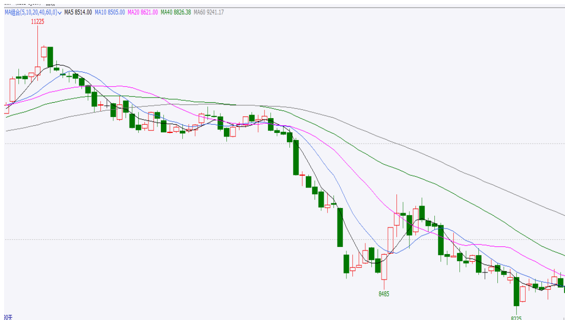
图 3 90 日期期货行情走势

截止本周四，红枣期货合约 CJ109 开盘 8505，最高 8565，最低 8440，收盘 8450，涨-145 元/吨，涨幅-1.69%，成交量 46521 手，持仓量 49464 手，日增仓 1407 手。