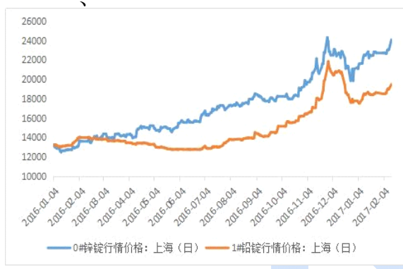
铅锌主流地区期货库存图