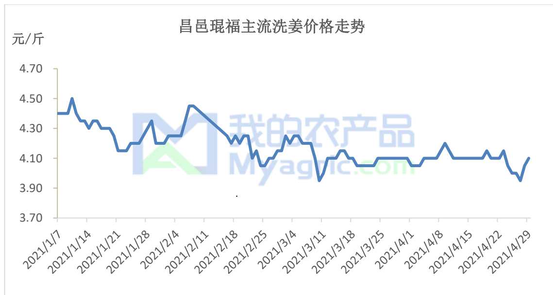
图 1 国内主产区主流价格走势

本周生姜产区行情运行震荡，走货时快时慢，价格小幅频繁调整。北方大姜产区市场前期上货量增加，下货不快，行情显疲，价格下探，后期上货量稍减并保持平稳，走货略有加快，价格缓慢回升，不过整体来看，价格波动不大。小黄姜各产区总体行情维持稳弱，走货不快，价格暂稳。本周山东产区市场货源供应量与上周基本持平，受农忙和成交价格不理想影响，各大产区农户出货积极性仍一般，客商多是刚需补货为主，整体交易情况一般，走货缓稳。