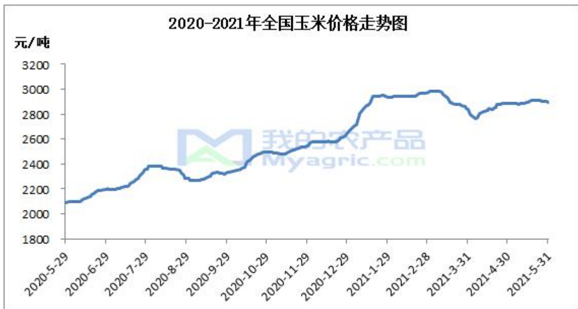
图 1 全国玉米价格走势

本月东北产区玉米价格震荡偏强运行。5月份是东北产区玉米春播期，今年种肥价格和去年相当，租地成本大幅上涨50%，将推高新一季玉米生产成本，基层种植玉米积极性较高，预计今年东北产区玉米种植面积或将增加10%。基层农户余粮基本出尽，市场购销清淡，粮源主要集中在中间贸易环节，今年贸易商收粮建库成本整体偏高，对玉米价格构成支撑。截止到月末，哈尔滨玉米市场价格为2730元/吨，较月初上涨30元/吨；长春地区玉米市场价格为2740元/吨，较月初上涨10元/吨。现阶段东北深加工企业库存充裕，饲料企业寻求其他价优替代谷物，玉米需求仍未改善，产区贸易商走货较差。现阶段贸易商出库意愿增加，但售粮成本支撑贸易商挺价销售，