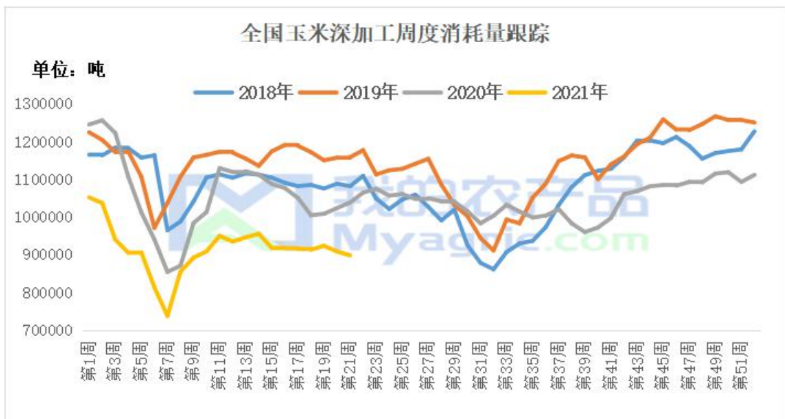
图 8 全国玉米深加工企业周度消耗量

5 月份国内深加工企业整体运行平稳，个别企业受区域环保影响限产或停产。我的农产品网跟踪数据显示，2021 年 5 月，全国主要 119 家玉米深加工企业（含淀粉、酒精及氨基酸企业）共消费玉米 364 万吨，较上月减少 6 万吨；与去年同比减少 43 万吨。