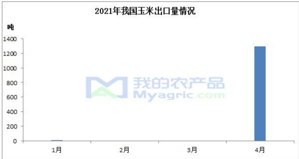
图 9 玉米出口数量

据海关数据统计，2021 年 4 月份我国玉米出口量为 1299.23 吨。截止到 2021 年 4 月份，我国玉米累计出口量约 1299.24 吨，同比减少 20.07%。