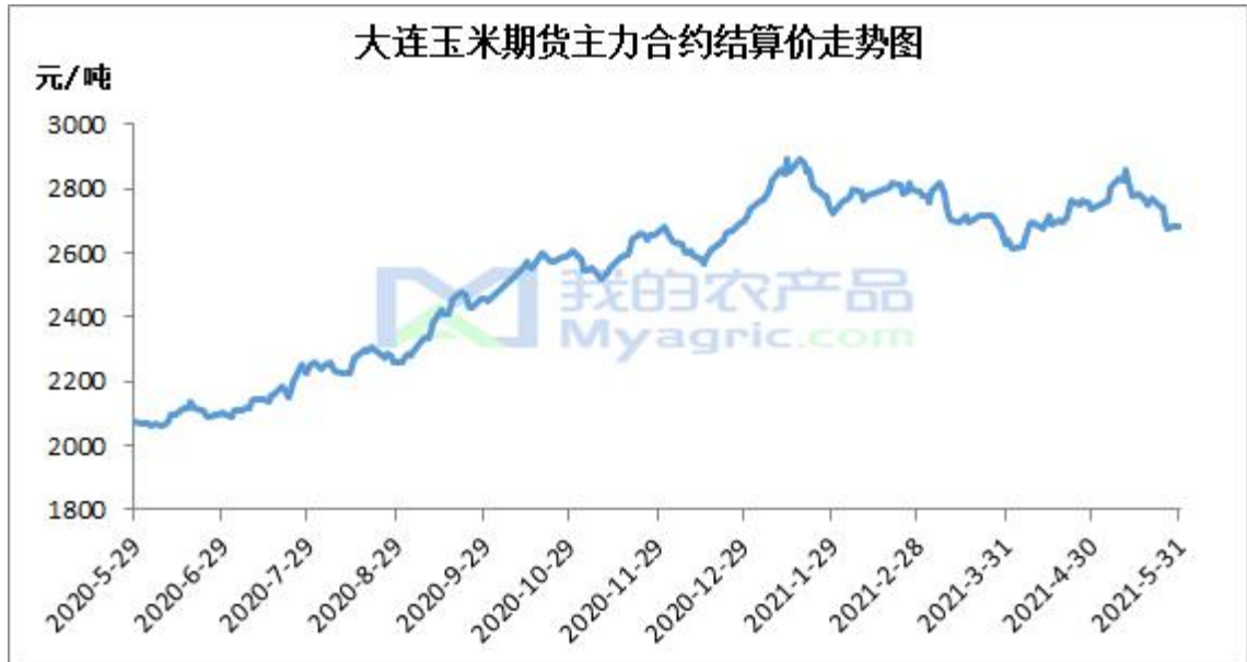
图 3 大连玉米期货主力合约结算价走势图

本月大连盘玉米主力合约 C2109 结算价格呈现先涨后震荡下跌的态势。基本面看，华北地区月初贸易商为小麦腾库，出货积极，深加工企业根据门前到厂车辆灵活调整收购价格；东北地区玉米价格以稳为主，市场活跃度不高；南方销区下游饲料企业维持刚性需求，贸易商现货成交不畅。截止本月底（5月31日）大连盘主力合约 C2109 结算价格为 2683 元/吨，较上月底(4月30日)跌 53 元/吨，跌幅 1.94%。