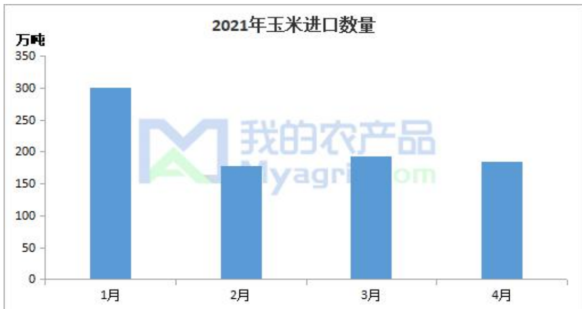
图 5 玉米进口数量

中国海关数据显示，2021 年 4 月份我国共进口玉米 185 万吨，进口量环比下降 4.15%，同比 2020 年 4 月份进口增长 107.87%。截止到 4 月份，我国玉米累计进口 857 万吨，同比 2020 年 1-4 月增长 300.47%。