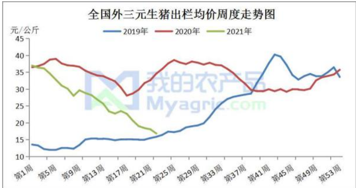
图 7 生猪价格走势

本周外三元生猪主流出栏均价 16.82 元/公斤，较上周下跌 1.25 元/公斤，环比-6.90%，同比-51.40%。终端需求疲软，鲜品白条销售不畅，屠企承压走货，屠宰量无明显变化；同时，正值月初，规模场出栏计划较月底有所减量，但是由于大猪冲击市场猪价，散户扛价心态有所崩塌，降价销售走量，猪价持续下行。在当前供需两低形势下，预计短期猪价偏弱运行。