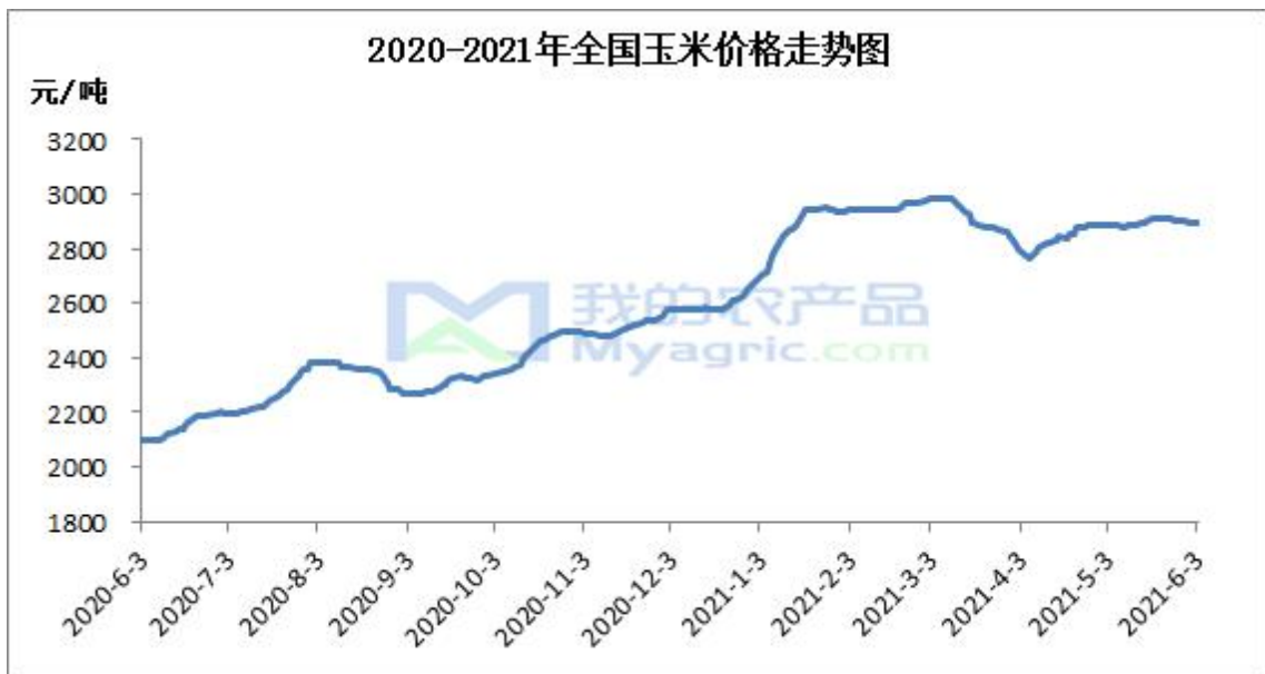
图 1 国内玉米价格走势

本周东北地区玉米贸易价格稳定运行。截止至6月3日，哈尔滨玉米市场价格为2730元/吨，较上周持平；长春地区玉米市场价格为2740元/吨，较上周持平。目前深加工企业处玉米库存充裕，收购意愿不强，多数深加工企业已经停止收购，部分企业下调收购价格。由于今年贸易环节囤粮成本较高，贸易商仍有挺价销售意愿。在本地需求较差情况下，部分粮源小批量发往关内。玉米购销仍较为清淡，预计短期内玉米价格弱稳为主，近期需关注华北及山东地区情况。