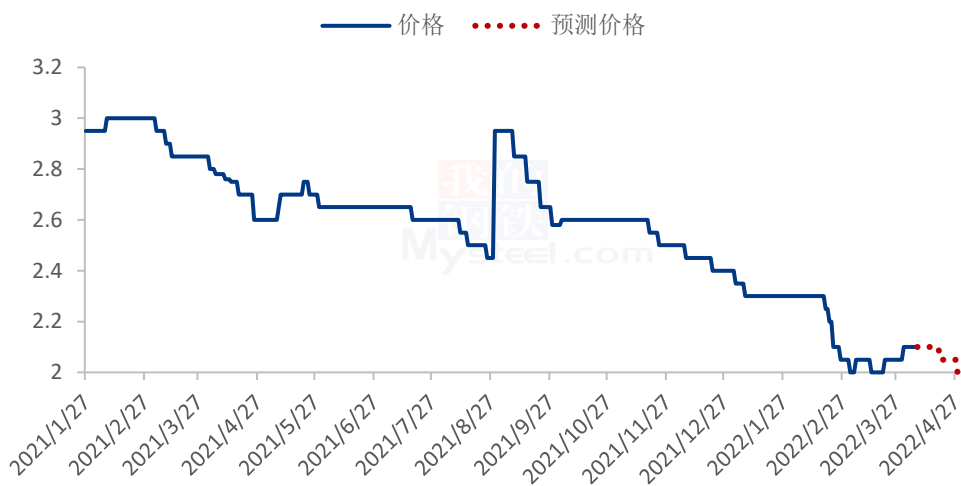
(2021-2022年) 赤峰张杂13号谷子价格走势 (元/斤)

谷子市场购销僵持，供需矛盾尖锐。价格稳中偏弱运行，Mysteel 农产品认为随着需求减少，米厂开机率将进一步降低，价格或难以为继。另外春播临近，新季种植面积有望减少，长远来看或将利好谷市。