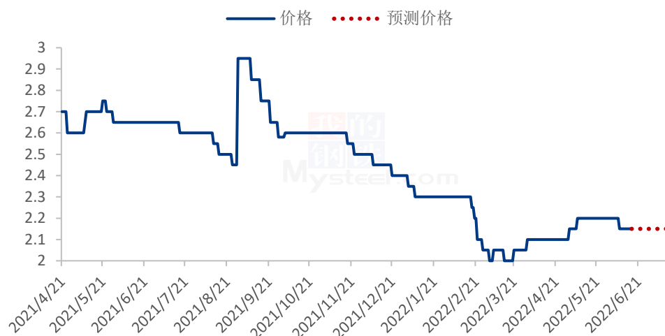
(2021-2022年) 赤峰张杂13号谷子价格走势 (元/斤)

后期市场关注重点应集中在新谷长势情况上，天气、温度等情况或也将对产量造成影响，进而影响市场心态变化。