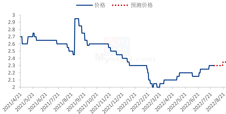
(2021-2022年) 赤峰张杂13号谷子价格走势 (元/斤)

产区惜售心态坚挺，对原粮价格形成利好支撑，产区粮商持续性采购对价格形成利好支撑，短期内影响谷价波动的主要因素为产区心态及采购情况，下游对整体市场影响有限。Mysteel 农产品认为短期内谷价无下跌风险，8月底前谷价应受利好支撑。