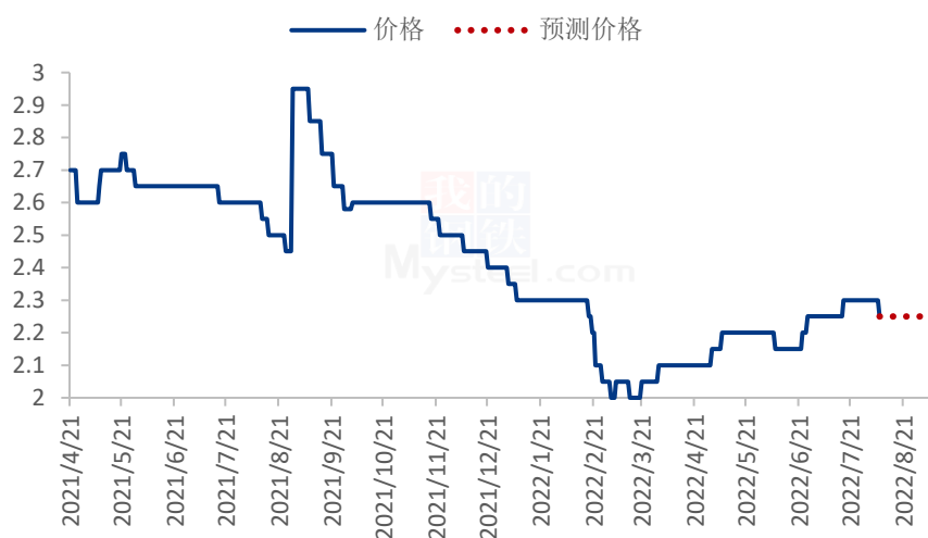
(2021-2022年) 赤峰张杂13号谷子价格走势 (元/斤)

目前下游市场流通小米以山东河南新米和部分陈米为主，九月下旬开始，东北谷子将陆续收割上市。临近收割还需关注产区天气状况，近期需多关注产区降雨及霜降天气，将影响新谷收割晾晒，且上市时间将会有所推移。