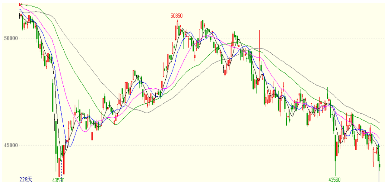
图一 12日沪铜1503合约K线走势图