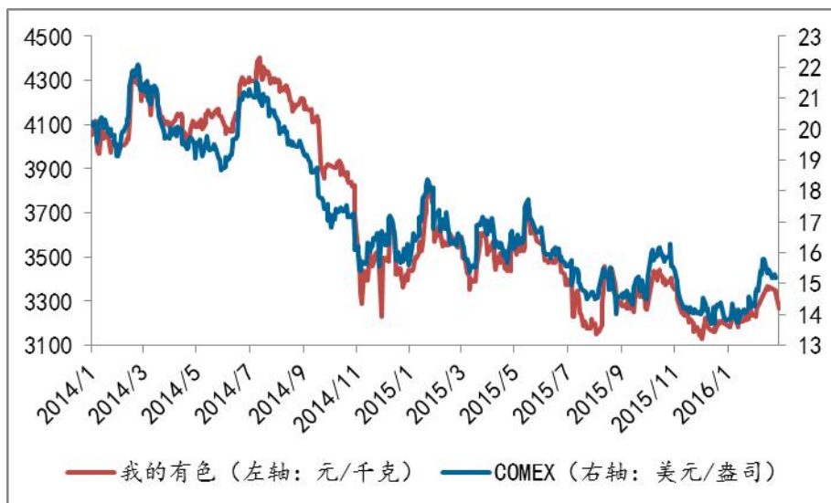
图一 2014-2016 年白银价格走势