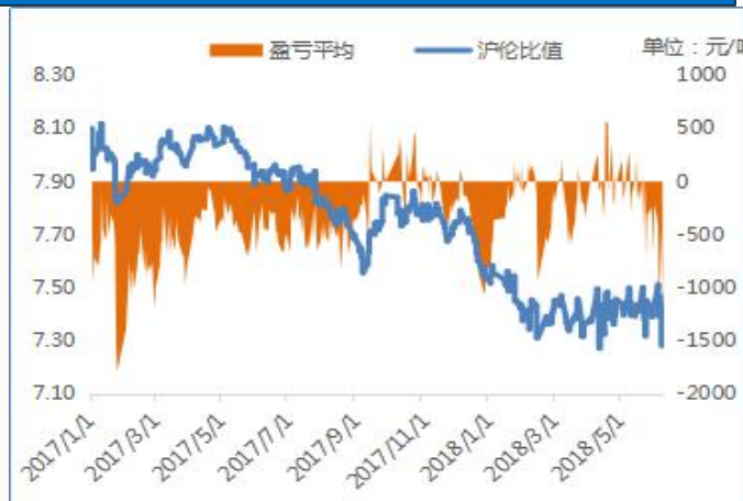
美元兑人民币汇率图