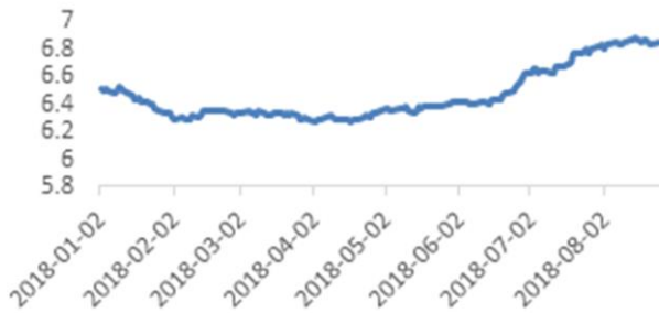
美元兑人民币价格走势