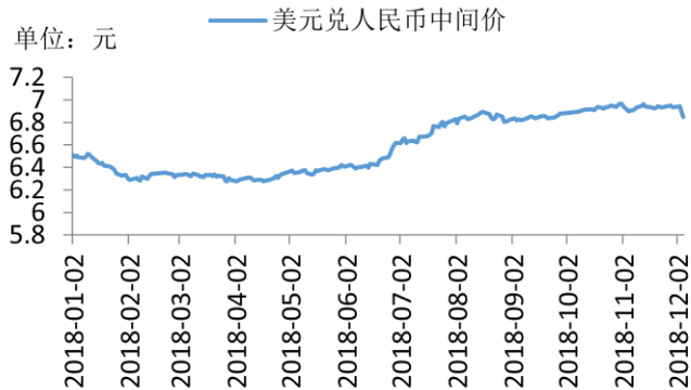
美元兑人民币中间价