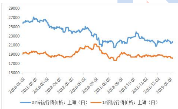
铅锌主流地区期货库存