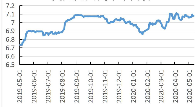
美元兑人民币中间价